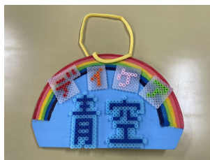
創作活動 ~青空看板づくり~