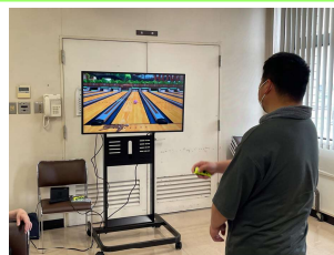
ゲームの日(テーブルゲームやテレビゲームなど)