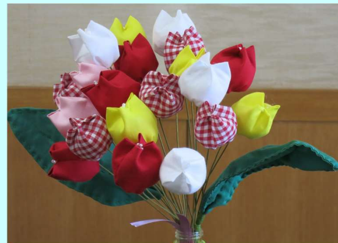
デイケア活動で作成した 『チューリップ』