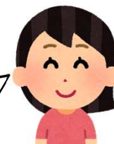
40代女性 デイケア利用歴:10年

フリータイムでは創作活動をしながら、スタッフの方や他のメンバーとの会話を楽しんでいます。ゆったりとした雰囲気、たまに眠たくなることも、この雰囲気が社協デイケアの良いところだと思います。