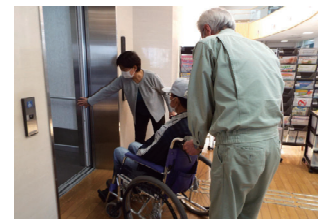
車いす講習の様子

■内 容：午後1時30分～1時40分 ういるかみすの活動紹介 午後1時40分～2時40分 『安全な車いすの操作方法』 講師：介護福祉士 午後2時40分～3時00分 現在活動している協力会員との情報交換～一緒に活動してみませんか？～