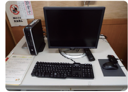
パソコン・プリンター