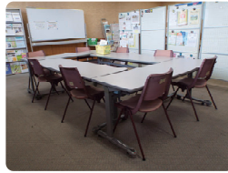
ミーティングスペース