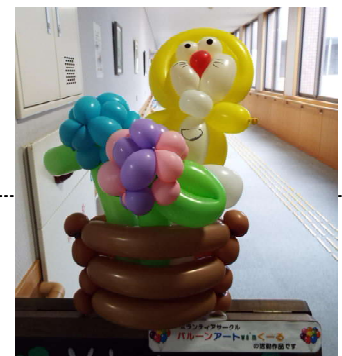
5月の作品テーマは あじさい 『紫陽花』