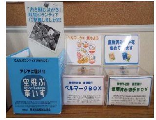
使用済み切手等収集箱

ボランティアセンターでは、様々な市民活動を実践している個人・団体の方々にボランティア登録をしていただいています。自分たちで新しいグループを作りたい、グループに入って一緒に活動したい、簡単にできる活動を紹介してほしいなど、その想いをボランティアコーディネーターがサポートします。また、センター入口には使用済み切手やベルマーク、書き損じハガキの収集、茨城フードバンクと連携している「きずなBOX」を設置しており、気軽に寄付ができます。