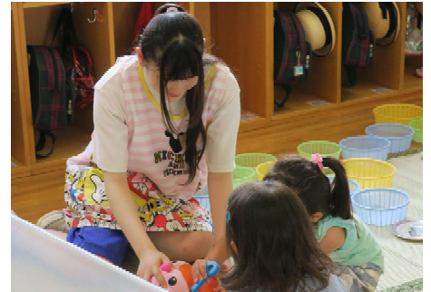
市内保育園での実習場面

※本会ホームページでは過去のアシストカレッジ報告記事を掲載していますので、ぜひご覧ください。 ( https://www.kamisushakyo.jp )