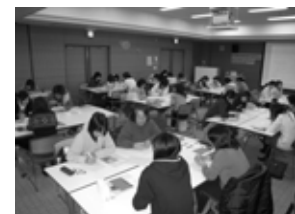
第4期研修会の様子

※11月11日（水）、12月2日（水）は、地域ネットワーク勉強会との合同開催となります。この研修会に申し込みされない方でも自由に参加できますので、お問い合わせの上ご参加下さい。