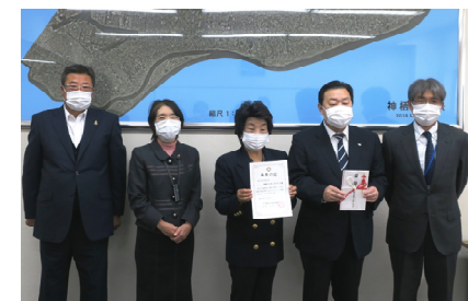
同クラブ野口様(写真左)、池田様(写真左から2番目)、社協狭山常務理事(写真右)

※使用済切手、使用済カードは茨城県社協を通じ県内のボランティア活動振興に、他の預託品は福祉施設、学校等で活用されます。