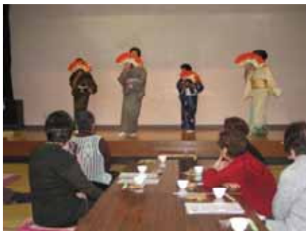
ボランティアによる演芸も好評です

☆開催のご案内は、社協に登録されている65歳以上のひとり暮らしの方へ、お住まいの地区の民生委員さんを通じ、お知らせしています。