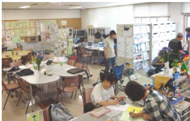
どなたでも自由に使えるスペースです