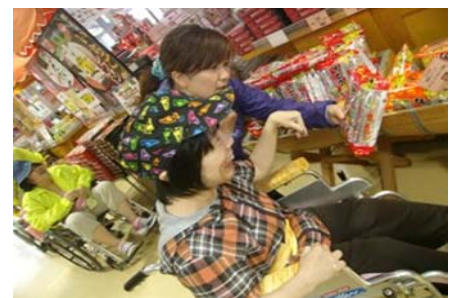
「道の駅いたこ」での買い物の様子。

活動の例: 市内商店や道の駅などでの買い物や、お花見や見学の付き添い、施設内の運動会…など