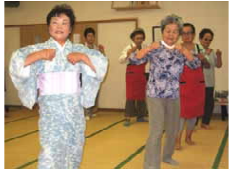
はさきサロンの定番「大漁節」。自然に手踊りが始まります。

いいにおいがしてきた頃、おしゃれをした参加者の皆さんが会場に到着し、「久しぶりだなあ～元気だった？」と挨拶する声が聞こえはじめます。サロンの一番の楽しみは、そこに集う仲間。ひと月ぶりの再会をお互い喜び、仲間と歌と踊りで1日を楽しみました。