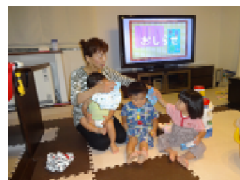
お風呂上がりでリラックスモード

これからもサポーターとして積極的に参加し、若いママたちに少しでも協力できたら幸せです。これからも頑張りますので、よろしくお願ひします。