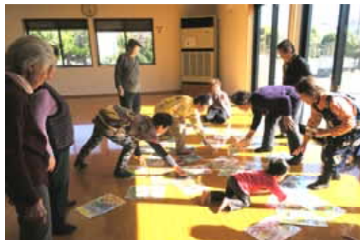
昼食の前にかかるた取り。ボランティアのお孫さんも参加しました。その元気な様子に、参加者一同、にっこりしました。

「家にいるだけだと、笑うことが少なくてね。外に出て、人と会って話すから笑顔になれるんだよ」と、参加者のひとりが話してくれました。