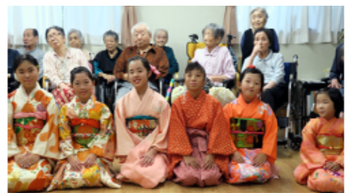
施設利用者のみなさんと記念撮影

子どもたちも「おじいちゃん、おばあちゃんから“かわいいね”“これからも続けてね”“また来てね”と言ってもらえて嬉しい。これからも踊りを続けたい」と笑顔で話してくれました。