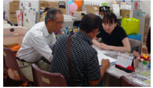
コーディネーターが相談に応じます。

また、年度切り替えに伴うボランティア登録（更新）手続きと併せて、ボランティア活動保険への加入をお勧めしています。ボランティア活動を始めたい方や活動に関心のある方も、お気軽にお問合せください。