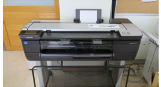
大判プリンターはJFE条鋼(株)鹿島製造所から寄贈していただきました。