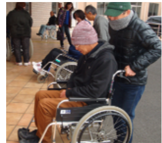
昨年 の 車いす講習の様子

男性の参加も大歓迎です！現在、協力会員の約半数が男性で、庭木のせん定や通院の付き添い等で活躍しています！皆さん、お気軽にご参加ください。