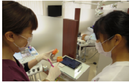
昨年度の職場体験の様子

高校生のみなさんが、専門職が働く実際の現場で“専門職に必要な知識や技術”を学び、職業選択や福祉・医療の資格取得を目指す一助となることを目的として開催しています。将来、専門職として働きたいと考えている方、同じ思いを持つ仲間と一緒に学びませんか？ぜひご参加ください！