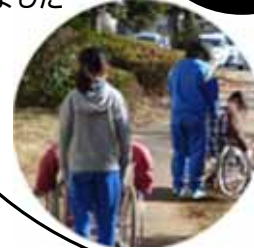
ホームヘルプサービスの運営...7,798千円 訪問件数 2,424件、訪問時間数 2623.5時間