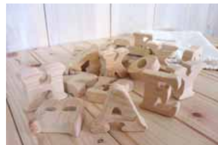
木工アルファベット 1セット2,300円

【問合せ先】一般社団法人O.K.factory Kichi-Kuro【キチクロ】 神栖市下幡木3919-47 電話：0299-77-7111