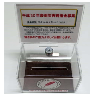
箱の大きさは高さ205mm、幅164mm、奥行120mmです

平成30年7月豪雨災害義援金の募金箱を置いていただける商店・飲食店等の事業所様を募集しています。お申し出のあった商店様には、右写真の募金箱をお届けし、義援金受付期間中の設置協力をお願いしています。市内の事業所で、募金箱設置にご協力いただける際は、ぜひ社会福祉協議会までご連絡ください。