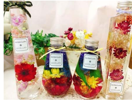
ハーバリウム 1つ 1,500円~