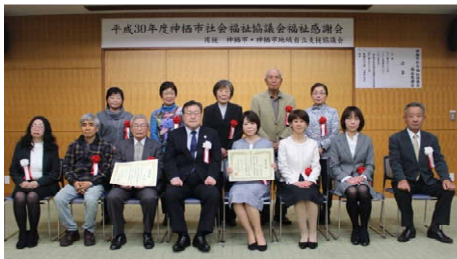
当日出席された受賞者の皆様で記念撮影