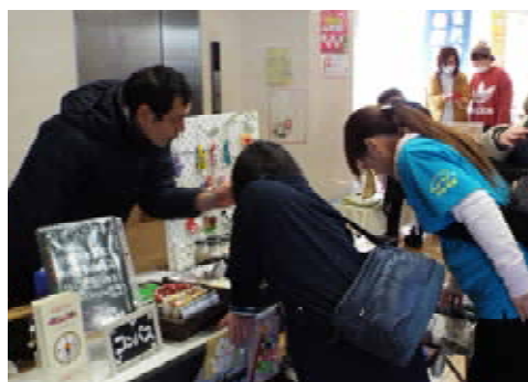
当日は、市内障害者福祉施設による製品展示・販売がありました。(出店事業所・順不同)ハミングハウス、障がい者就労支援センターKichi-Kuro、グッドライフ神栖、神栖啓愛園、障がい者就労支援センターコンパス、福祉作業所きぼうの家、デイサービスセンターのぞみ

※順不同、敬称略。在職・活動期間は平成30年4月1日をもって算定しています。 ※社会福祉の分野で国、茨城県、茨城県社会福祉協議会、神栖市などから表彰を受けていない方を対象としています。