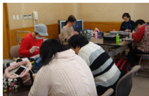
フリータイムでは、無理なく自分のペースで活動に取り組みます。

対象者 精神科・心療内科に定期通院治療中で、主治医からデイケアの利用について了解を得られた方 開催 神栖地区「靑空」(神栖市保健福祉会館 溝口1746-1) 毎週水・金曜日 午前10時～午後3時、毎週木曜日 午前10時～正午 波崎地区「ほのぼの」(はさき福祉センター 土合本町3-9809-158) 毎週火曜日 午前10時～午後3時 費用 無料 調理や外出活動などは200～300円の実費を頂いています。