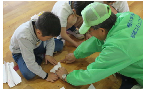
昔遊びを通じた地域の高齢者との交流。

学校や企業等の依頼に応じて、その学習や取り組み内容、状況に合った体験プログラムを依頼者と共に計画します。昨年度、小学校からの依頼には、児童が楽しみながら福祉を学ぶために、高齢者や障害のある方、ボランティア活動をされている方などの協力により、様々な人々とふれあい、支え合うプランを提案させていただきました。また、企業等からの依頼には、高齢者介護者の会との意見交換会や地域の障害者福祉施設との交流会などをコーディネートすることも可能です。プログラム作りから体験の実施、振り返りまでサポートします。お気軽にご相談ください。