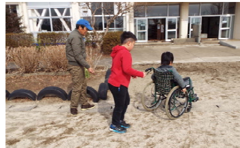
車いす体験。相手を思いやる心を育みます。