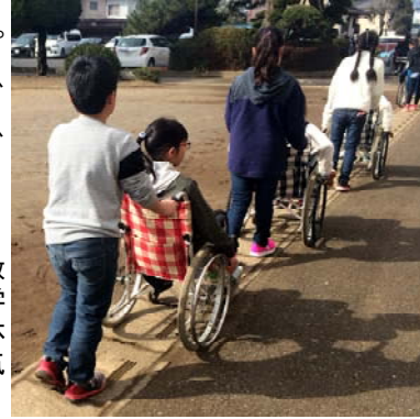
軽野小学校での福祉教育出前講座。いつもの学校で、車いすの介助を体験し、介助される側の気持ちも学びました。

神栖市社協は、神栖市の地域福祉推進に市民の皆様と共に取り組む団体です。福祉サービスや制度を充実させながら、新たな福祉課題・生活課題に向き合い、必要とされる先駆的事業を進めていきます。今年度も、市民、行政、各専門機関、学校、企業の皆様のご参加、ご協力をお願い申し上げます。