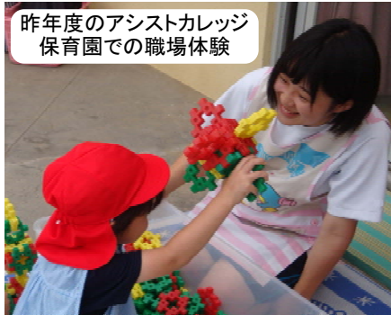
昨年度のアシストカレッジ 保育園での職場体験

進路アシストカレッジは、ソーシャルワーカーや介護職、看護職、保育者などの仕事に興味・関心がある高校生を対象に、福祉や医療の現場で実際に体験することで、将来の職業選択や資格取得を目指すきっかけになることを目的としています。高校卒業後の進路として、福祉・医療・保育関係の大学や専門学校への進学、就職を考えている仲間と共に将来の仕事について学び合うことができる機会ですので、ぜひご参加ください。