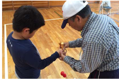
けん玉遊びを児童に伝えます

今年度は市内小中学校11校で出前講座を実施し、延べ1,173名が体験しました(令和元年11月末現在)。今回はそのうち3校の取り組みを紹介します。