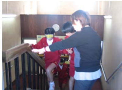
視覚障害を理解するためのアイマスク体験

9月27日(金)、10月11日(金)の2日間、総合的な学習の時間で「ふれあい ささえあう 思いやりの心」をテーマに体の動きを制限する高齢者疑似体験、視覚障害者の生活のしにくさを感じるアイマスク体験、車いすを利用している方の生活や気持ちを学ぶ車いす体験に取り組みました。介助方法を学ぶだけでなく、自分には何ができるのか体験を通してを考えることが大切であると伝えました。