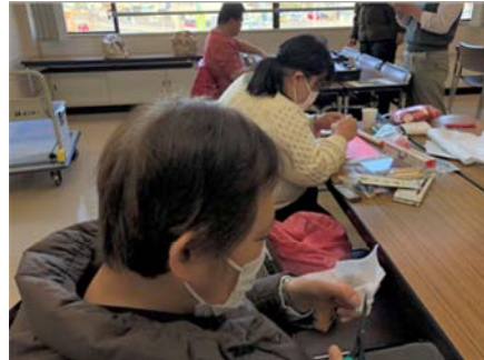
フリータイムで創作活動に取り組む参加者

活動の中心であるフリータイムでは、アイロンビーズや裁縫などの創作活動に取り組む方や、「デイケアは落ち着く」との理由で、読書や音楽鑑賞などを楽しむ方もいます。デイケアを利用する理由は人それぞれ違います。スタッフは、その方の目標や気持ちに寄り添いながら、本人のペースで活動に取り組めるよう支援をしています。精神保健デイケアに興味・関心のある方は、お気軽にお問合せください。