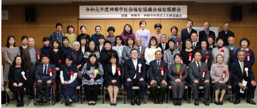
当日出席された受賞者の皆様、式典で修了証を授与された第9期発達障害療育者研修修了者の皆様で記念撮影

※順不同、敬称略。在職・活動期間は平成31年4月1日(民生委員・児童委員は令和元年11月30日)をもって算定しています。 ※社会福祉の分野で国、茨城県、茨城県社会福祉協議会、神栖市などから表彰を受けていない方を対象としています。