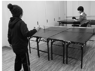
軽スポーツは人気プログラムのひとつで熱戦が繰り広げられます

レクリエーションでは卓球や柔らかいボールを使ってキャッチボールなどを行っています。体を動かしながらだと自然とメンバーとの会話も弾みます。