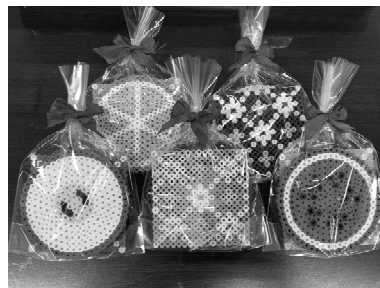
アイロンビーズで作成したコースター