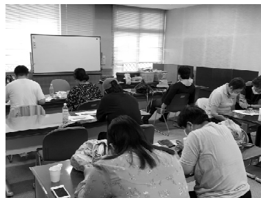
自由な時間が過ごせるフリータイム

フリータイムでは裁縫やアイロンビーズなど創作活動を自分のペースで行いながら、スタッフや他のメンバーとの会話を楽しんでいます。年に数回、製作物の販売をします。販売会に向けた作品づくりも楽しみの一つです。