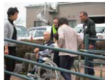
車いすでのスロープ体験