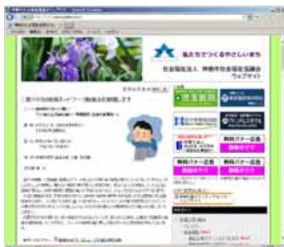
(社協ウェブサイト)