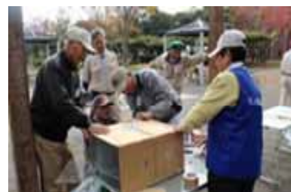
ピザ釜づくりの様子

【4日目】日 時 平成28年11月12日(水) 10時～13時 場 所 神之池バーベキュー広場 参加者 14名 講 師 ボーイスカウト神栖第一団 内 容 〈交流会〉災害時にも役立つアウトドア料理！ (段ボールを使ったピザ焼き、アルミ缶を使った炊飯)