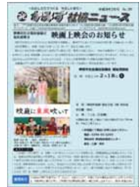
「かみす社協ニュース」

本会情報公開規程に定める情報公開の推進に向け、本会事業概要、定款及び役員名簿、事業計画書及び収支予算、事業報告及び収支決算等について、一般の閲覧に供するだけでなく、本会発行の広報紙やホームページでは、神栖市の地域福祉に多くの市民が参加・協力してもらえるような情報提供を心がけました。