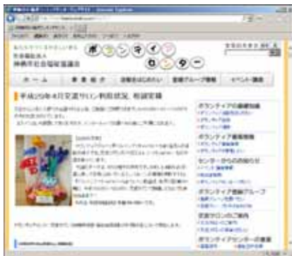
(ボランティアセンターウェブサイト)