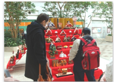
路線バスでの外出 (2月14日)