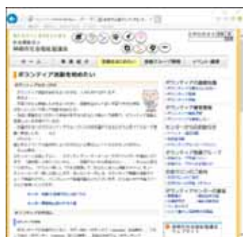
(ボランティアセンターウェブサイト)