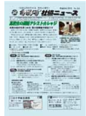
「かみす社協ニュース」

本会情報公開規程に定める情報公開の推進に向け、本会事業概要、定款及び役員名簿、事業計画書及び収支予算、事業報告及び収支決算等について、一般の閲覧に供するだけでなく、本会発行の広報紙やホームページでは、神栖市の地域福祉に多くの市民が参加・協力してもらえるような情報提供を心がけました。