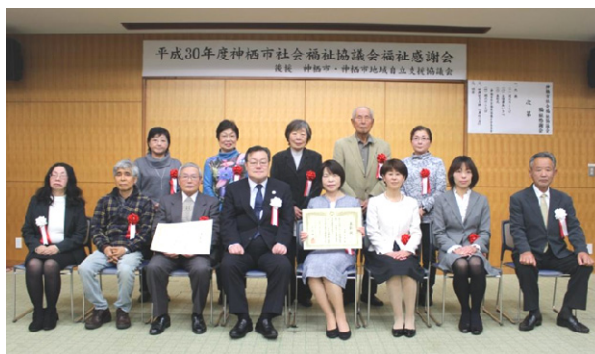
受賞者のみなさん

期 日 平成31年2月16日（土） 場 所 保健・福祉会館 研修室 内 容 表彰式典及び記念映画上映会 『真白の恋』 参加者 71名（前年度の参加者 137名）