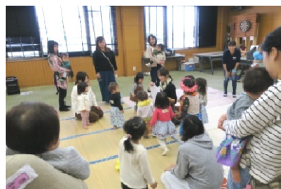
多くの親子、サポーターが参加し、 会員同士交流を深めました