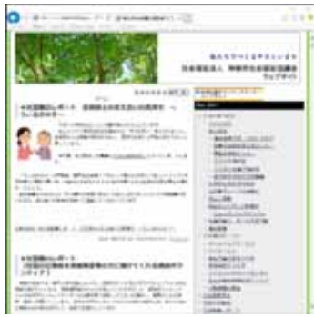
(社協ウェブサイト)