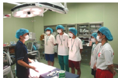
神栖済生会病院での実習

障害者施設：Kichi-Kuro(キチクロ)、ハミングハウス、でいサービスみなど、 福祉作業所きぼうの家、デイサービスセンターのぞみ